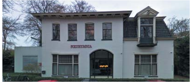
VILLA POLYHYMNIA - PENTATONE GEBOUW

Als je rond het jaar 2000 een meerkanaals bestandsformaat met een hoge resolutie wilde gebruiken om zowel de minuscule micro- als de gigantische macrodynamiek van klassieke muziek in al haar verschillende klankkleuren en ruimtelijke pracht vast te leggen, dan was het DSD-formaat (zoals het aan de opnamekant van het proces heet) je enige mogelijkheid. En laat dat nu net het bestandsformaat zijn waar Polyhymnia zich - in technisch opzicht - in heeft gespecialiseerd.