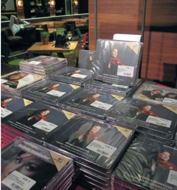
MOZART CD'S BIJ HET DUSSMANN EVENT